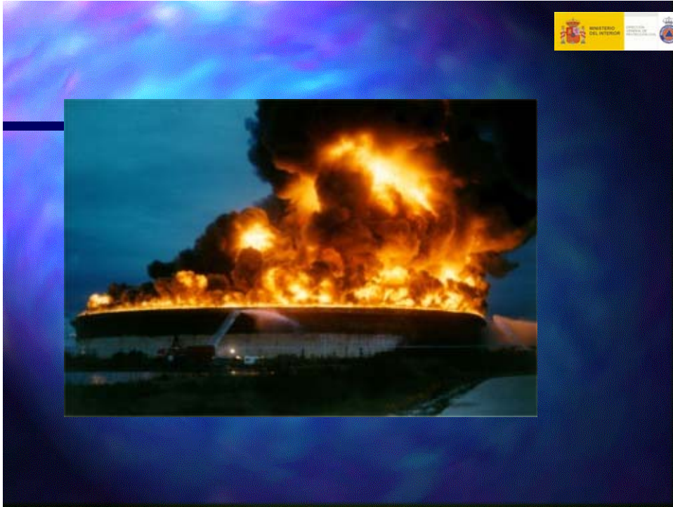
Incendio de charco con forma cilíndrica