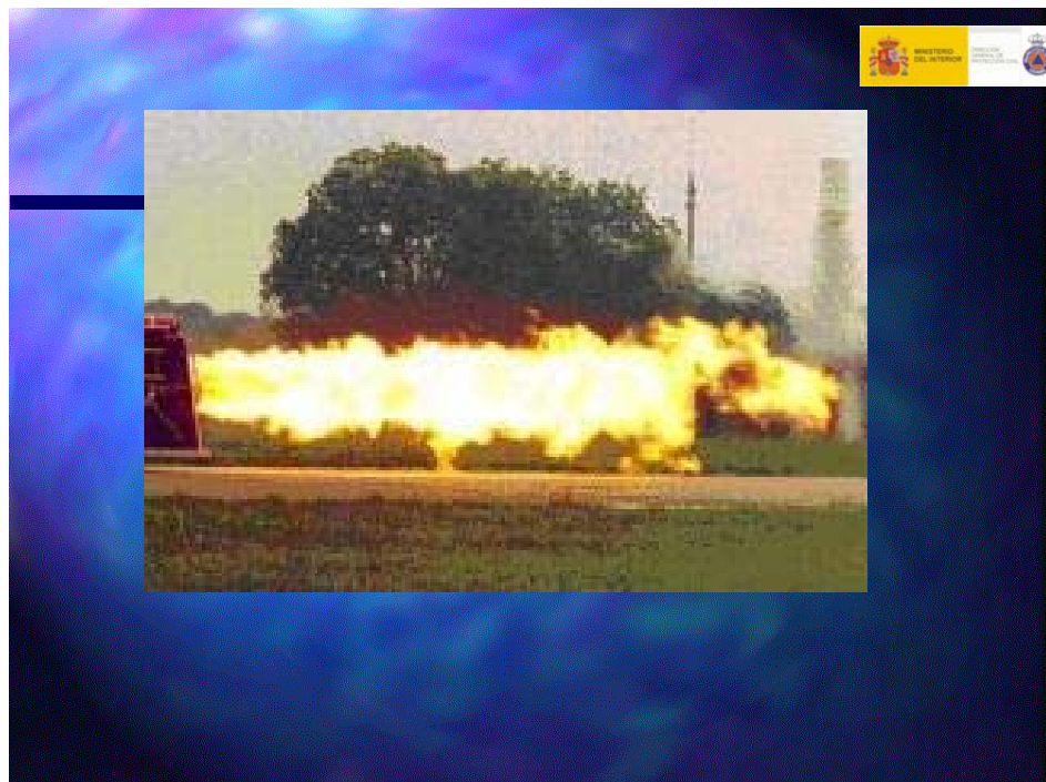
Incendio de tipo dardo de fuego