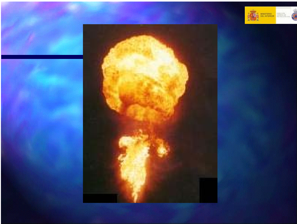
Desarrollo de una bola de fuego